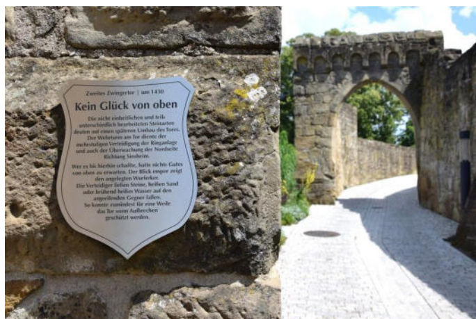
Eine der neuen Informationstafeln an der Burg Steinsberg