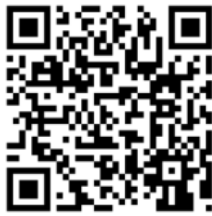
QR-Code Meine Umwelt-App

Die Landesanstalt für Bienenkunde der Universität Hohenheim prüft die eingehenden Meldungen und gibt bei Nestfunden den Meldenden weitere Instruktionen und unterstützt bei der Vermittlung von sachkundigen Personen für die Nestentfernung.