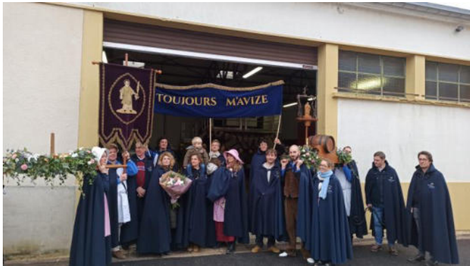
In traditionelle Gewänder gehüllt, begleiteten die Avizer Winzer die Figur des Heiligen Vincent an seinen neuen Standort, das Weingut de Sousa im Zentrum von Avize. (Text und Foto: Daniel Hagmann)

Vor seiner Rückreise nach Sulzfeld am Sonntagnachmittag besprachen Hagmann und Gentet das nächste Treffen zwischen Avizern und Sulzfeldern, das im kommenden Juni stattfinden wird. Nähere Infos hierzu folgen in Kürze.