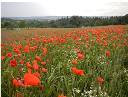
Artenreiches Weizenfeld im Kraichgau

Für Fragen rund um die Veranstaltung mit dem Ökomobil steht Tobias Lepp vom Regierungspräsidium Karlsruhe gerne zur Verfügung (Telefon: 0721/926-7701; E-Mail: Tobias.Lepp@rpk.bwl.de).