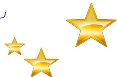
Sarina Pfründer Bürgermeisterin