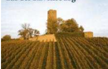
Sommer-Konzerte 2011 auf der Ravensburg