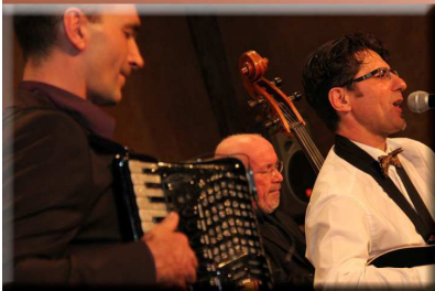
Trio For me-dable

französische Chansons Freitag, 28.01. ab 20 Uhr